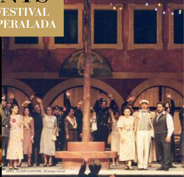
1993_ _ELISIR D'AMORE_ ©Josep Aznar