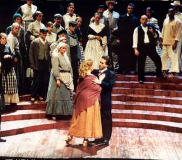
2002_ _MARINA_